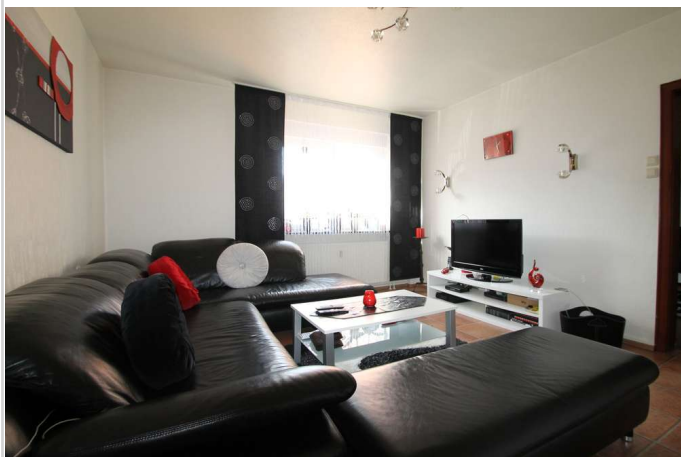
Beispiel: EG- Whg.

Zimmer: 26,00 Wohnfläche ca.: 609,00 m 2 Kaufpreis: 469.000,00 EUR