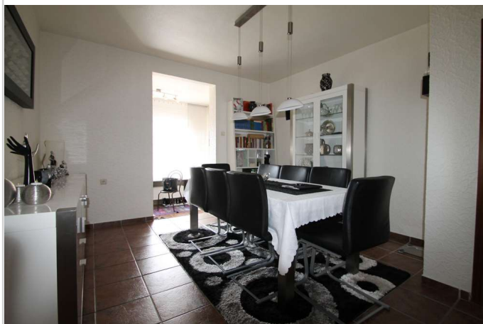
Beispiel: EG- Whg.